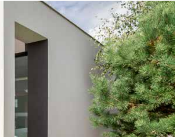
Diplomat Inverter Mini