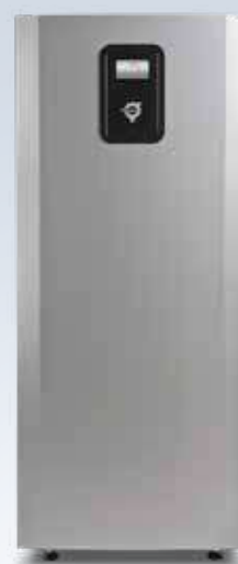
Mega L et Mega XL

Classe énergétique A+++ , lorsque la pompe à chaleur fait partie d'un système intégré Classe énergétique A++ lorsque la pompe à chaleur est le seul générateur de chaleur Classes énergétiques conformes à la directive Ecodesign 811/2013