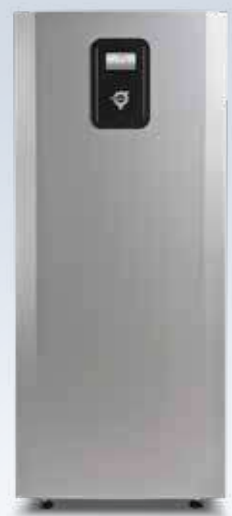
Mega L et Mega XL

Classe énergétique A+++ , lorsque la pompe à chaleur fait partie d'un système intégré Classe énergétique A++ lorsque la pompe à chaleur est le seul générateur de chaleur Classes énergétiques conformes à la directive Ecodesign 811/2013