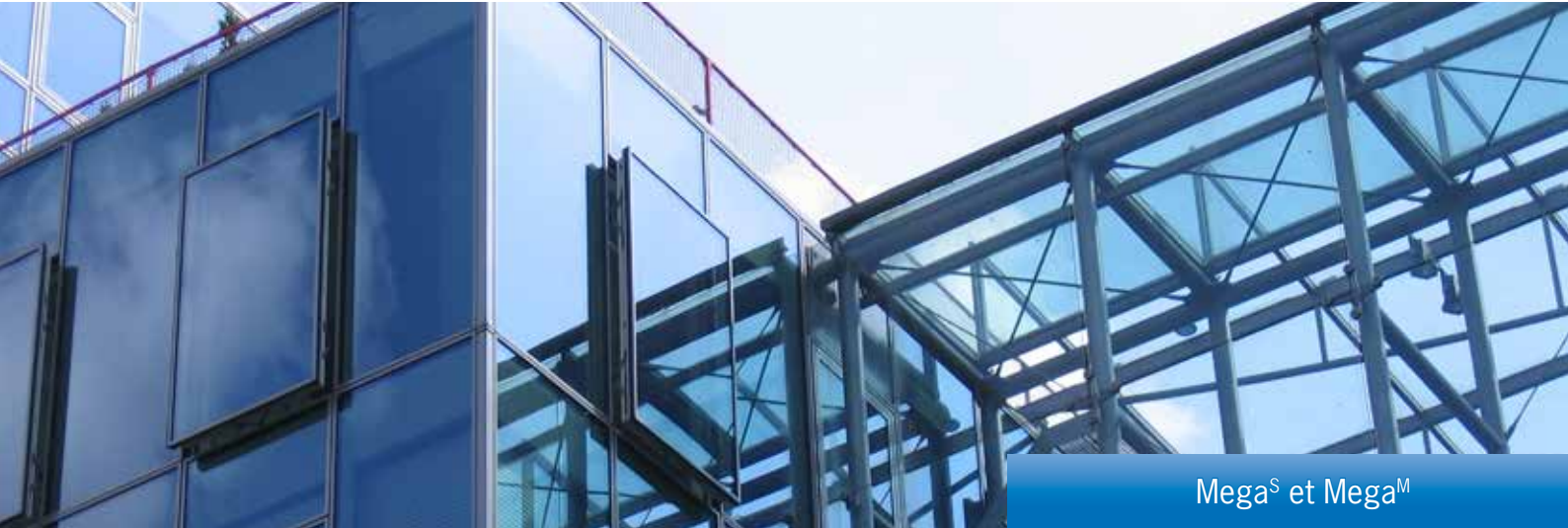
Mega S et Mega M